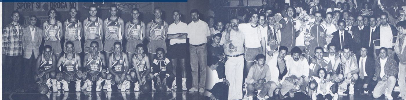
Stagione 1990-91: il roster completo e una foto dei festeggiamenti per la promozione in B2

ritorno da Sanremo dove aveva lavorato per la radio. Perdevamo di dieci punti ed aspettavamo il suo arrivo, perché per noi era importantissimo. Si cambiò in macchina, entrò nel secondo tempo e segnò trenta punti, facendoci vincere la partita in ri-